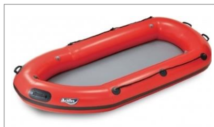
レスキューボート「DEIB-310」