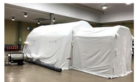
感染症対策用 陰・陽圧式 エアーテント「NP-45」