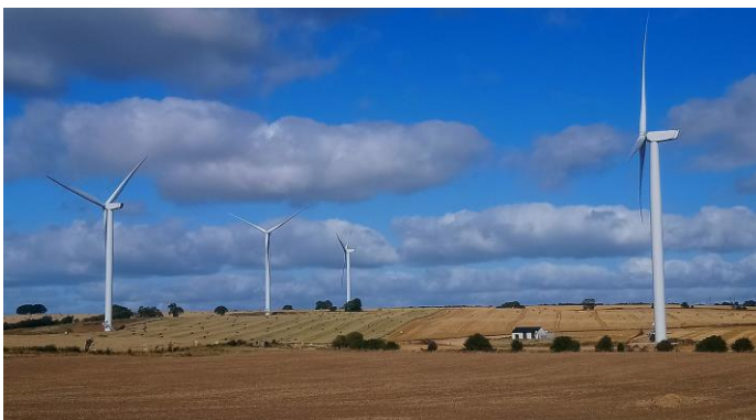
イメージ図（キャピタル・ダイナミックスが保有する陸上風力プロジェクト）